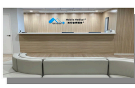
Yuen Long (New Territories West)