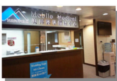
Tsuen Wan West (New Territories)