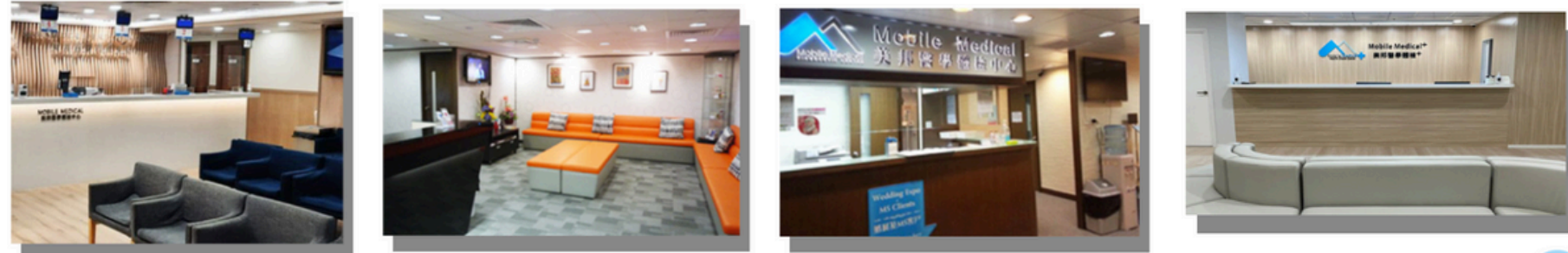
佐敦分店(九龍) 銅鑼灣分店(港島) 荃灣分店(新界) 元朗分店(新界西)